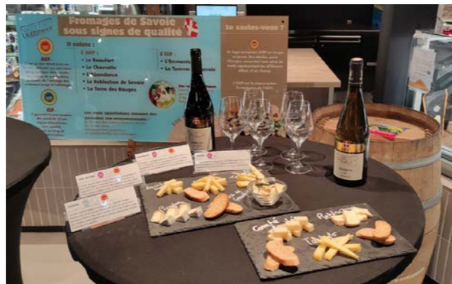
Fromagerie de l'Étoile, 9D avenue du Général de Gaulle Du 13 juillet au 31 août, tous les jeudis de 11h à 12h30. Prix : adulte : 20 € / enfant (moins de 12 ans) : 10 € Réservation à l'Office de Tourisme

La Fromagerie de l'Étoile invite à découvrir ou redécouvrir l'univers du fromage. Chaque semaine, une nouvelle sélection de fromages autour de la thématique des accords est proposée. En plus des traditionnelles associations vins/fromages , le fromage se prête très bien à des mariages sucrés/salés qui réveilleront les papilles des participants.