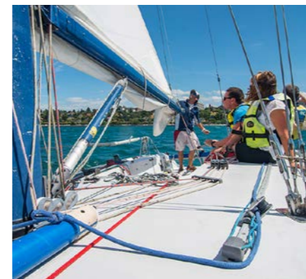
Tous les mardis, jeudis et samedis du 11 juillet au 31 août, de 13h30 à 15h ou de 15h30 à 17h. À partir de 6 ans. Prix : adulte 19 € / enfant (6-14 ans) : 14 € Réservation à l'Office de Tourisme

Au fil de l'eau et au gré du vent, l' école de voile de Thonon propose une balade sur un magnifique monocoque de 9 mètres . Cette sortie est l'occasion de découvrir le monde de la voile en participant activement aux manœuvres ou de simplement profiter du paysage.