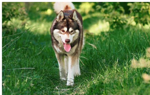
Parc nordique, Traineau Passion, Vailly Les mardis du 11 juillet au 29 août, de 10h à 11h30 Prix : 50 € par famille et par sulky - Réservation à l'Office de Tourisme

Une activité qui réunit tous les âges , sportifs ou non. Chaque famille prépare son matériel et attèle son chien . Les grands dirigent ce dernier, pendant que le plus petit de la famille (3 à 5 ans) peut s'installer tranquillement dans le sulky et profiter de la balade, autrement .