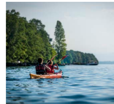
Tous les mercredis du 12 juillet au 30 août, de 18h à 20h. À partir de 5 ans. Prix : adulte 25 € / enfant (5-15 ans) : 20 € Réservation à l'Office de Tourisme

Cette activité encadrée permet d'apprécier le calme et l'immensité du lac en découvrant des lieux habituellement inaccessibles . La luminosité de fin de journée complète le spectacle avec un ciel aux couleurs changeantes, à l'approche du coucher du soleil .