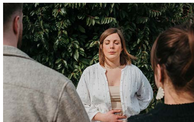
Parc de Corzent, un lundi par mois, de 10h à 11h30 À partir de 16 ans Prix : 18 € - Réservation à l'Office de Tourisme

Cette pratique de la sophrologie combine la marche en nature avec des exercices de relaxation et de respiration . C'est une expérience immersive qui aide chacun à accroître sa sérénité et à renouer avec son rythme intérieur. Le cadre naturel , entre lac et montagnes, permet de bénéficier des bienfaits apaisants et régénérants de la nature .