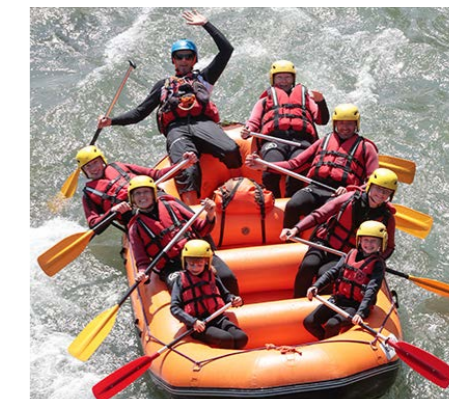
Tous les mardis du 11 juillet au 29 août, de 10h à 12h. À partir de 8 ans. Prix : 45 € Réservation à l'Office de Tourisme

En mode convivial, en famille ou entre amis, cette initiation à la descente en eau vive emmène ses participants sur une des rivières Dranse dans un canot de 6 à 8 personnes. Eclaboussures et rires garantis.