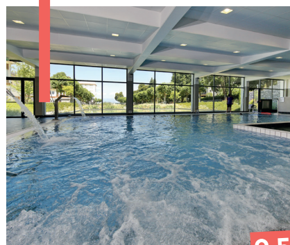
SPA THERMAL (VALVITAL) 19€