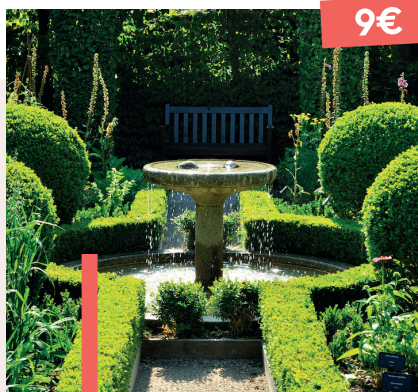
JARDIN DES 5 SENS 12€