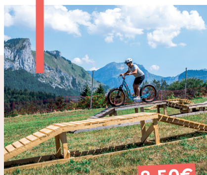
TROTTIN HERBE 12€